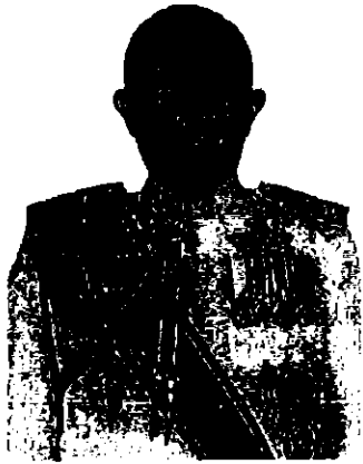
พลตำรวจโท เกียรติพงศ์ ชาวสำอางค์