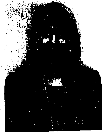
ศาสตราจารย์ ดร.พิรงรอง รามสูต