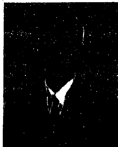
ศาสตราจารย์อารยะ ปรีชา เมตตา