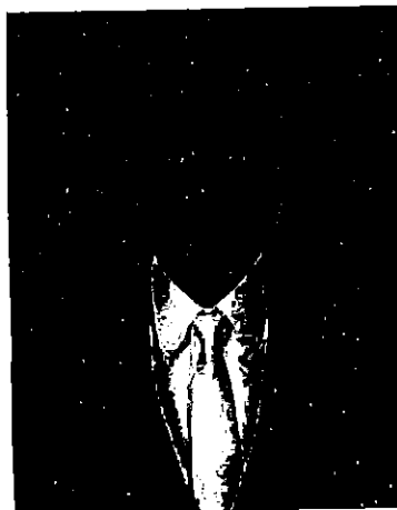
พลอากาศเอก มานัต วงษ์วาทย์